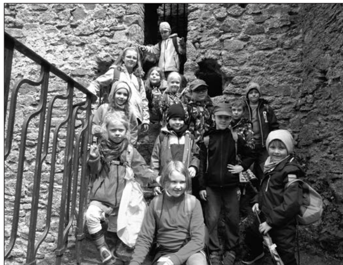
Děti z Tábořska Choustníku