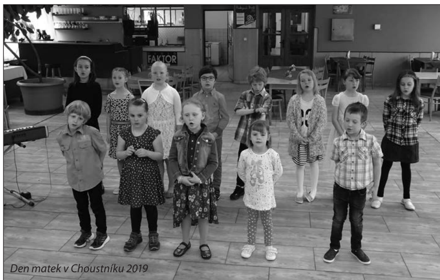
Den matek v Choustníku 2019

Také o zábavu bylo postaráno. Na úvod se předvedly děti pod vedením paní učitelky z mateřské školky, které se cvičily asi půlhodinové pásmo písní, tanečků a básniček. Odměnou jim byl vždy hlasitý potlesk. A že se jim to povedlo, bylo vidět i na tvářích maminek. Úsměvy střídaly slzy dojetí. Děti samozřejmě nepřišly zkrátka. I ony dostaly svou od-