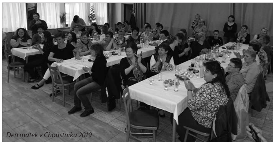
Den matek v Choustníku 2019

měnu v podobě pamlsků, občerstvení a zmrzlinových kornoutů. Pak nastal ten správný čas k popovídání a maminky ho řádně využily. V sále to vypadalo jako ve včelím úlu. Dalším bodem programu byla kapela Contraband, která dorazila kolem půl sedmé a od sedmi hodin měla na starost bavit přítomné dámy. Nejen, že se zpívalo, ale ani parket nezůstal