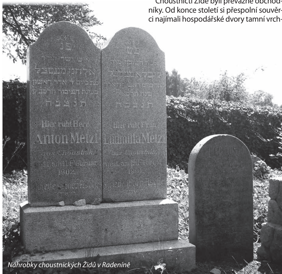
Náhrobky choustnických Židů v Radeníně